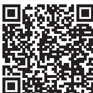
Moyamoya, maladie de (2013)