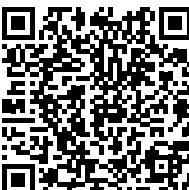
Artérite à cellules géantes - Maladie de Horton (2018)