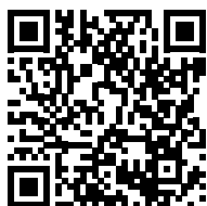
Fabry, maladie de (2011)